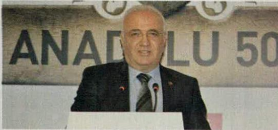
Mustafa Elitaş T.C. Ekonomi Bakanı