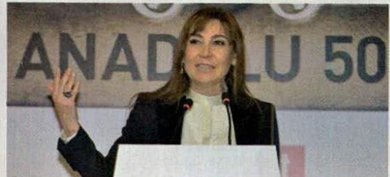
Vuslat Doğan Sabancı Hürriyet Gazetecilik Yönetim Kurulu Başkanı